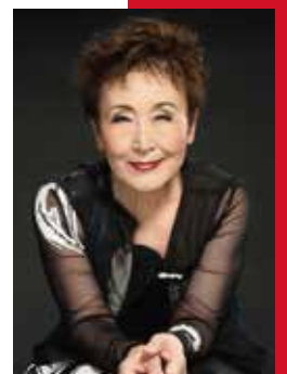
<ナレーション> 加藤登紀子

1960年愛媛県生まれ。テレビ局ディレクターを経て、2021年に独立。2004年、太平洋核実験によって日本のマグロ漁師が被曝した事実に出会い、映像化。映画「放射線を浴びたX年後」「放射線を浴びたX年後II」を制作。芸術選奨文部科学大臣賞、日本民間放送連盟賞、ギャラクシー賞、日本記者クラブ賞特別賞など受賞多数。